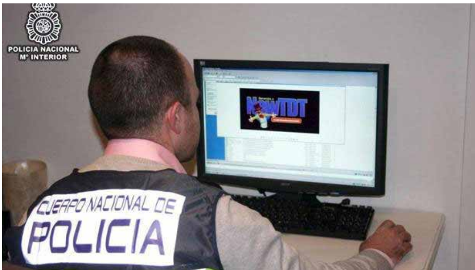
El sector editorial español pierde 200 millones de euros al año debido a la piratería.

* Con información de Cedro y Agencia EFE